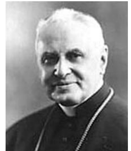
Cardinal E. Suhard (1874-1949)

Ser testimoni no consisteix a ser propagandista de la fe, ni a provocar agitacions socials, sinó a esdevenir humil referent del misteri de Déu. Significa viure de tal manera sense la qual la vida pròpia no tindria sentit si Déu no existís.